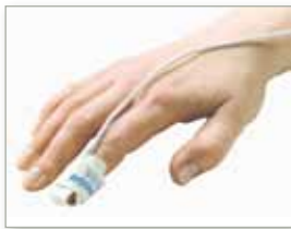
7000A für Erwachsene (> 30 kg Körpergewicht)