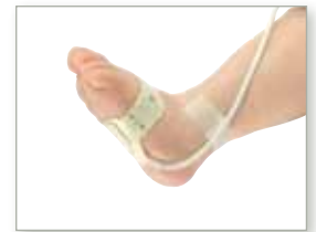
7000N für Neugeborene Neugeborene: (> 2 kg Körpergewicht) Erwachsene: (> 30 kg Körpergewicht)

Packungsgröße für alle Sensortypen: 24 Stück. Nur mit Nonin Pulsoximetrieprodukten verwenden.