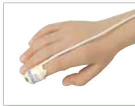
7000P für Kinder (> 10 kg Körpergewicht)