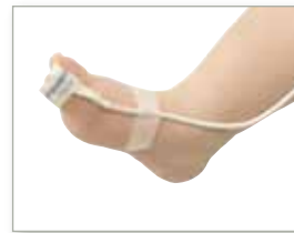
7000I für Kleinkinder (2 - 20 kg Körpergewicht)